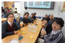
サントリービール工場見学

有志でのオフ会(ボウリング・BBQ・スポーツ観戦・辛口同好会・城部など)も多数われ、和気あいあいとしています。