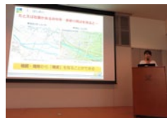
日本地理教育学会 2016

地形表現や特定のテーマに沿った地図データ整備など、当社が取り組む研究に関連する学協会で、年数回社員が発表しています。