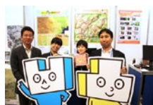
GISコミュニティフォーラム

GISコミュニティフォーラム、日比谷カレッジ(日比谷図書文化館)、青少年のための科学の祭典、G空間 EXPO、関連学会などで出展・講演しています。