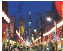
七夕祭、部署交流会