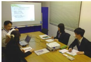
研修風景_部署の仕事