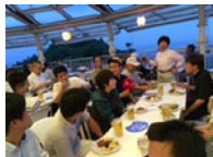
高尾山ピアマウント